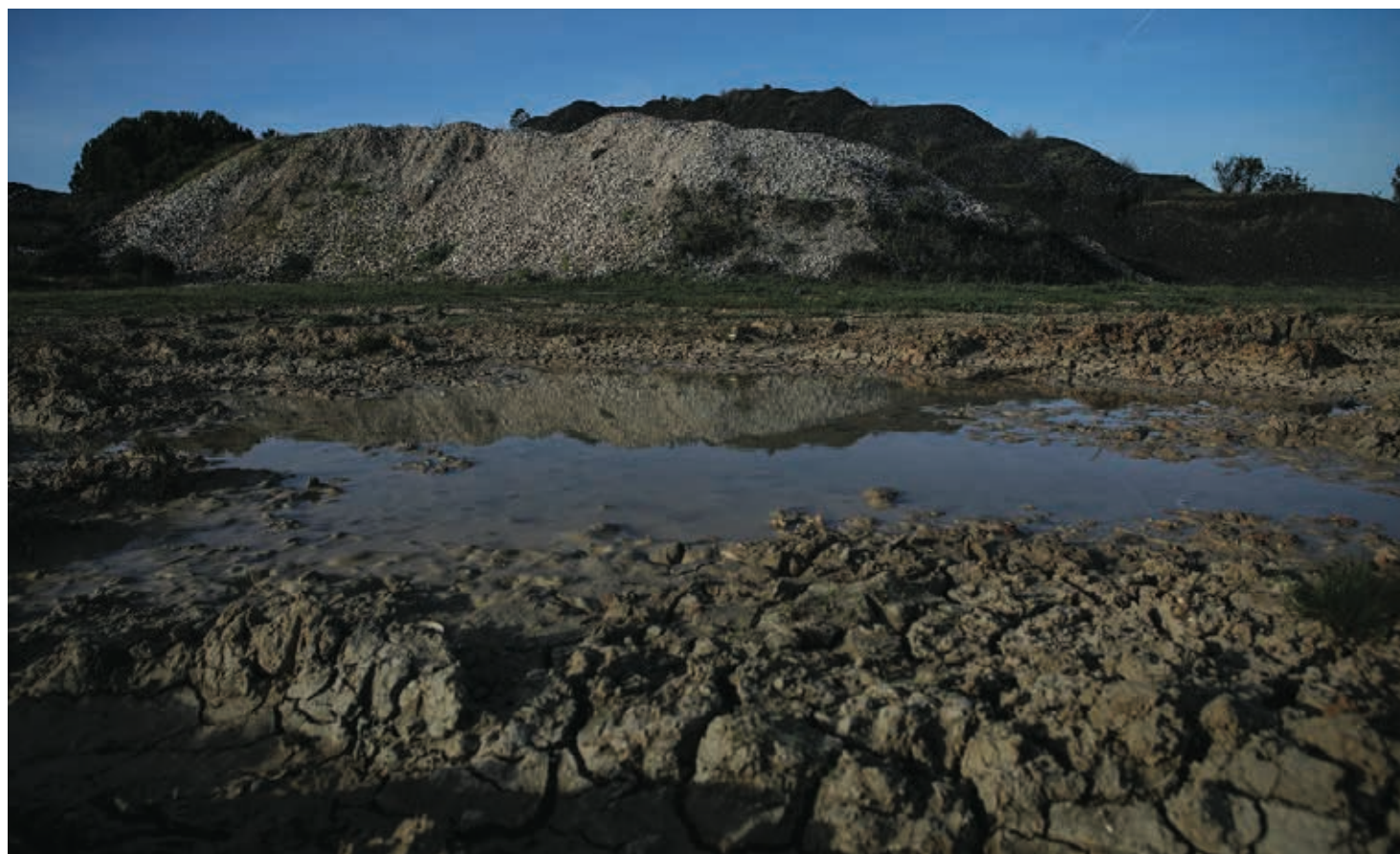
Processo de fiscalização iniciado pela autarquia, no final de fevereiro, foi interrompido pela pandemia

NÃO SÃO DA METALIMEX os resíduos que se encontram depositadas num terreno do Vale da Rosa, Setúbal. De quem são? Ninguém sabe. Não sabe a câmara municipal, não sabe o BCP, que é proprietário do terreno, não sabe a Junta de Freguesia do Sado, não sabe o Ministério do Ambiente e não sabem, tão pouco, os ambientalistas da Associação Zero. No meio de tanto desconhecimento sabe-se, no entanto, que os resíduos são ilegais e que constituem perigo para a saúde pública há mais de 20 anos, quando ali foram despejados.