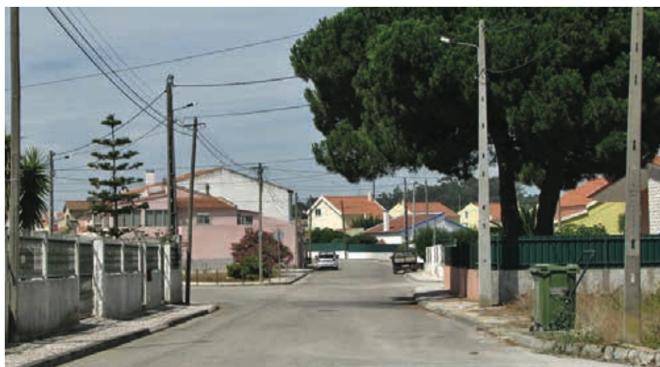
Reconversão na freguesia inclui Quinta das Flores, os Olhos de Água e as Marquesas II