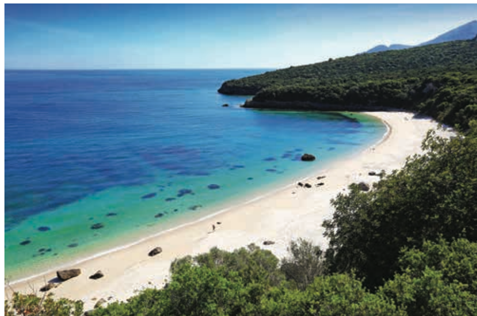
Recuperação do turismo no distrito pode ser alavancada pelo mercado nacional e pela retoma da aviação