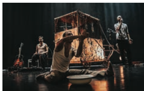
Mostra de Artes Performativas de Setúbal vai cumprir o calendário previsto