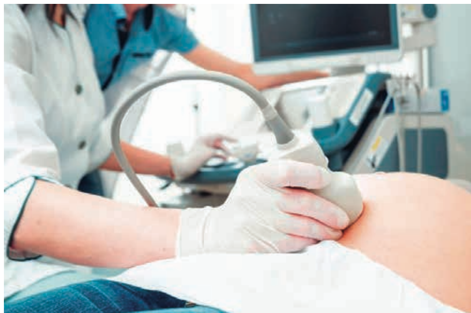
Serviço de ginecologia/obstetria devia ter 23 especialistas, mas conta apenas com uma dezena