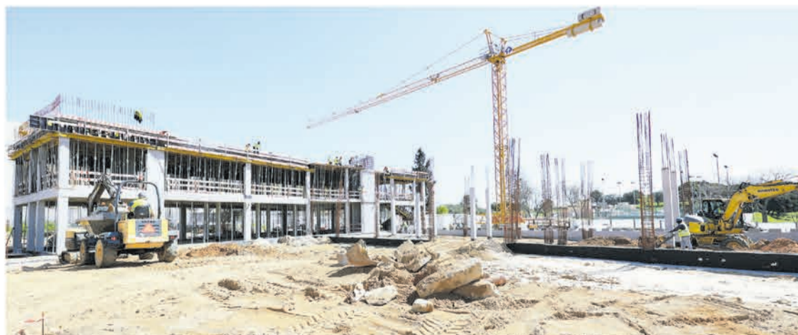
O município substituiu-se ao Estado para assumir a construção do Centro de Saúde da Bela Vista

Na reunião do programa municipal “Ouvir a População, Construir o Futuro”, André Martins sublinhou que o investimento no concelho atinge o va-