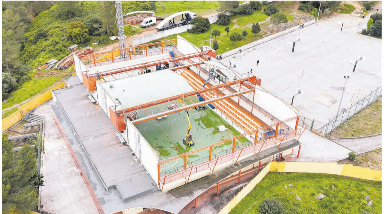
A nova cobertura, em fase de instalação, permite melhorar o conforto térmico dos utilizadores

Está igualmente prevista a renovação dos sistemas de se-