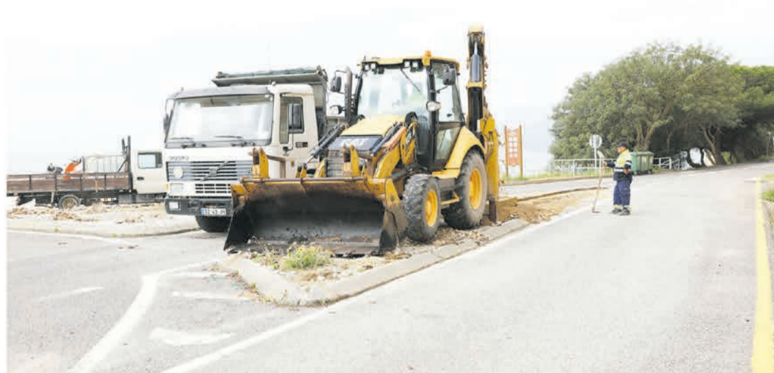
A criação de uma rotunda no acesso à Praia da Figueirinha melhora as condições de segurança e a fluidez da circulação

A obra consiste na execução de uma rotunda nas imediações da zona de acesso ao parque de estacionamento poente, com o objetivo de garantir uma maior fluidez na circulação automóvel e melhores con-