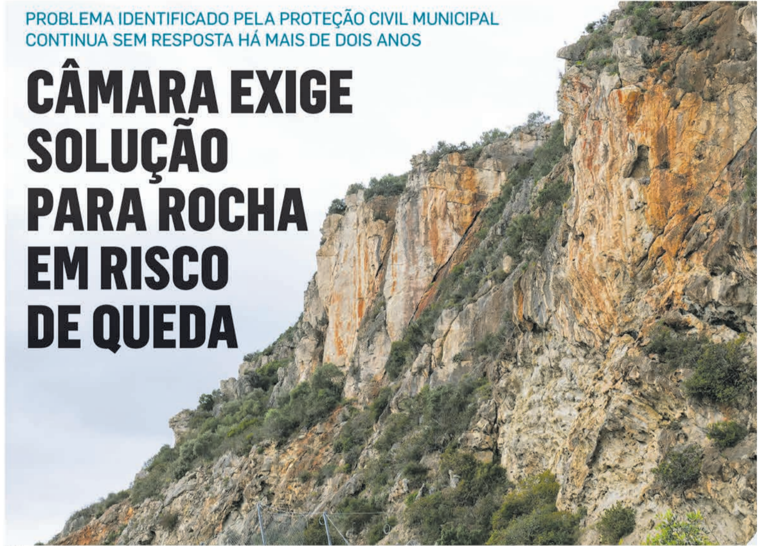
O bloco rochoso em risco de queda na estrada da Arrábida terá um peso superior a mil toneladas

da estrada da Arrábida "de forma a prever acidentes com pessoas e bens".