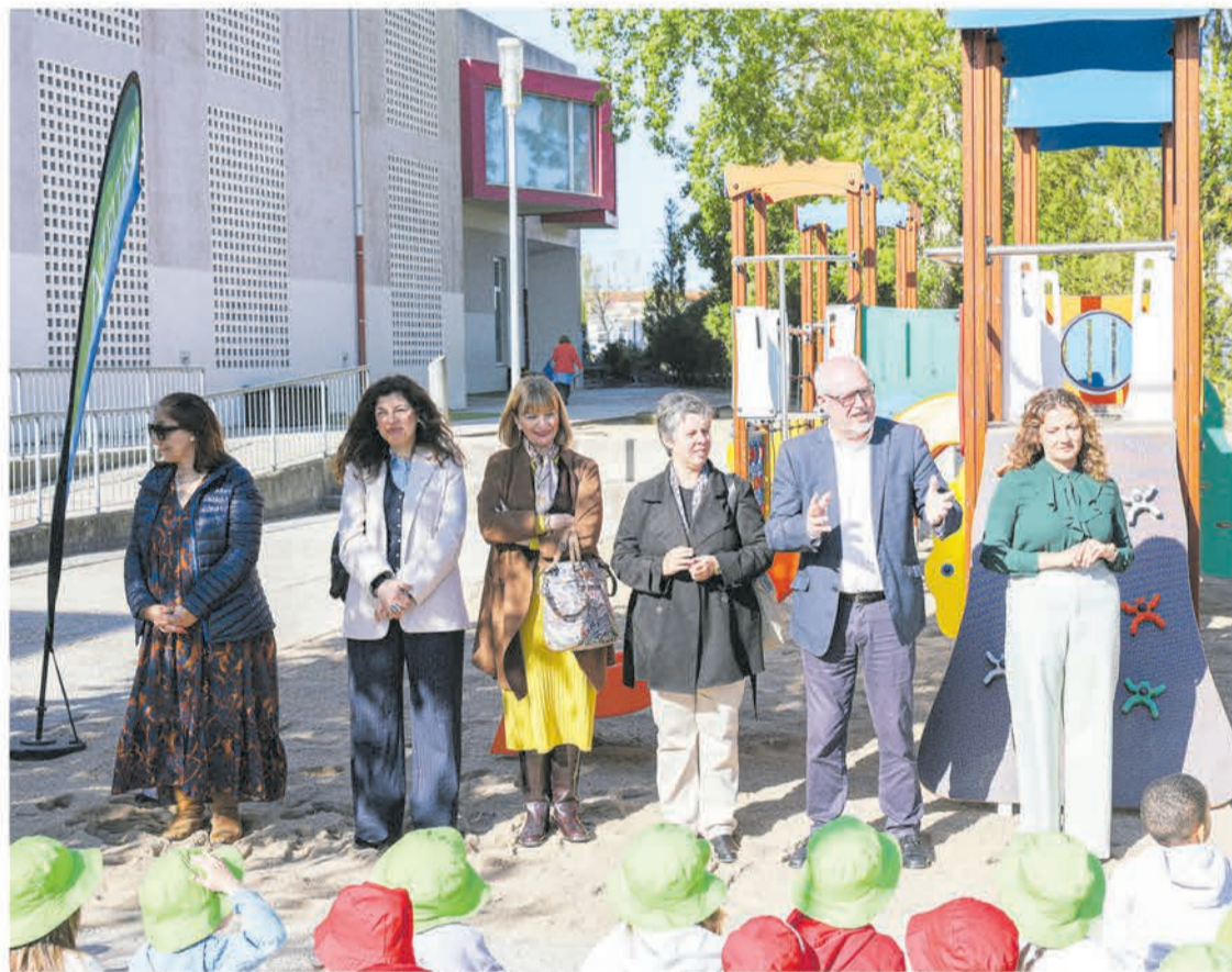
Uma das escolas beneficiadas no âmbito deste investimento qualificador foi a EB da Brejoira

"Tudo isto é feito garantindo as condições de segurança das nossas crianças nas nossas escolas, nos parques infantis do nosso concelho", disse o autarca, sublinhando que a Câmara