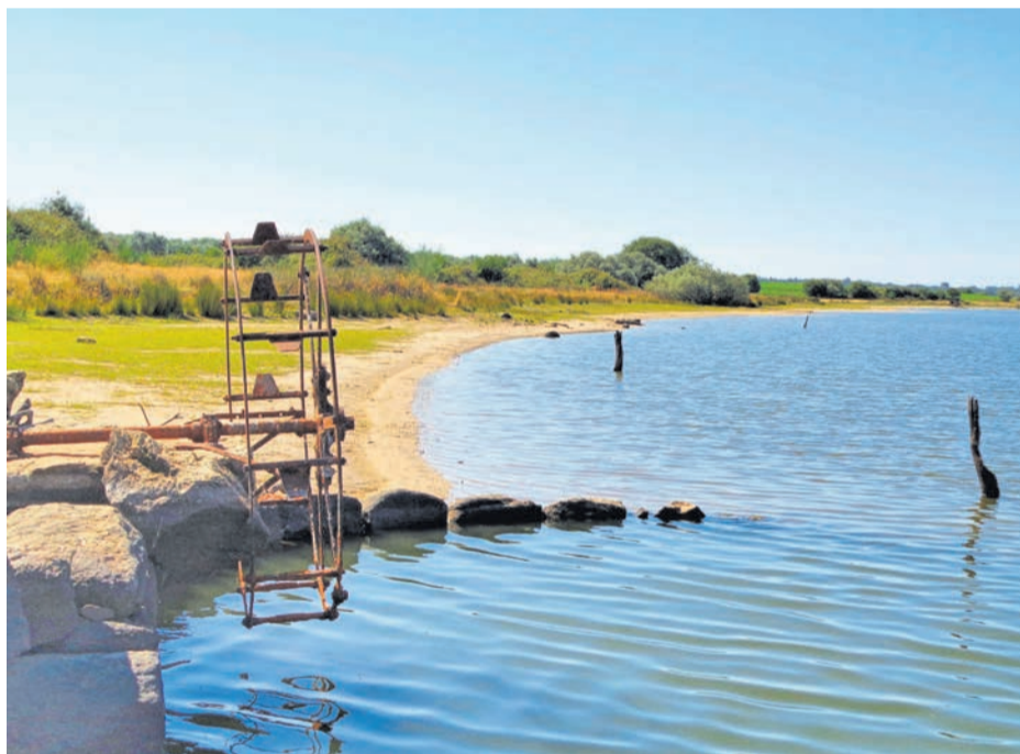
Entre 2009 e 2022 a lampreia sofreu um decréscimo de cerca de 40 por cento