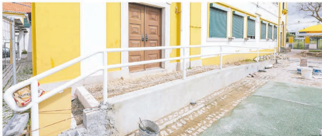
Na EB de Vila Nogueira são criadas rampas de acesso, com guardas metálicas de proteção

■ Edifícios públicos, em que se incluem escolas e um equipamento desportivo, estão a receber soluções de acessibilidade numa ação liderada pela Câmara Municipal de Setúbal. São englobadas na intervenção as escolas básicas de Vila Nogueira de Azeitão, de Brejos de Clérigo, de Vila Fresca de Azeitão, de Vendas de Azeitão, nº 1 do Faralhão, nº 4 dos Pinheirinhos, nº 7 da Fonte do Lavra, o Complexo Municipal