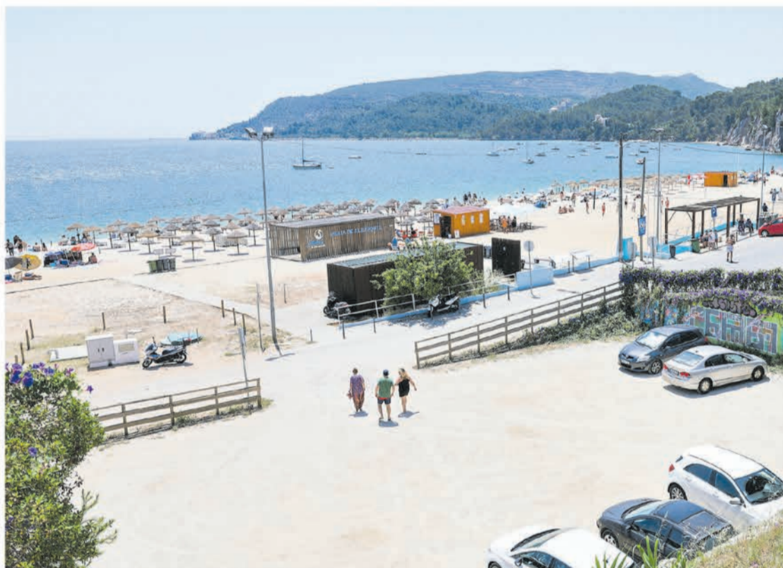
O investimento feito na Praia de Albarquel traduz-se no cumprimento dos critérios da Bandeira Azul

A atribuição destas distinções resulta da estratégia adotada pelo município de valorização dos territórios das praias de Setúbal, com um conjunto de novos equipamentos que acrescentam valor turístico e conforto e as tornam mais acessíveis a todos os utilizadores.