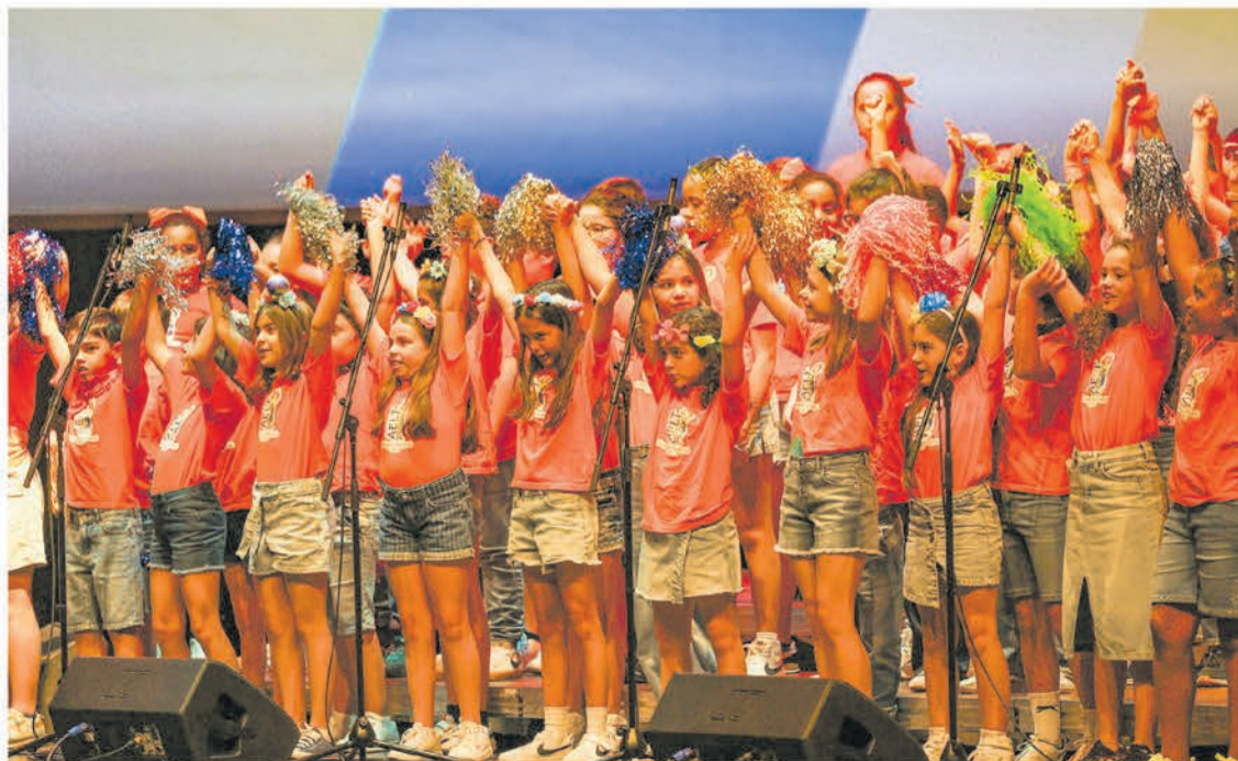
O evento conta com a participação de alunos, que partilham o palco com artistas de renome

A 14ª edição do evento, organizado pela A7M – Associação do Festival de Música de Setúbal com base numa par-