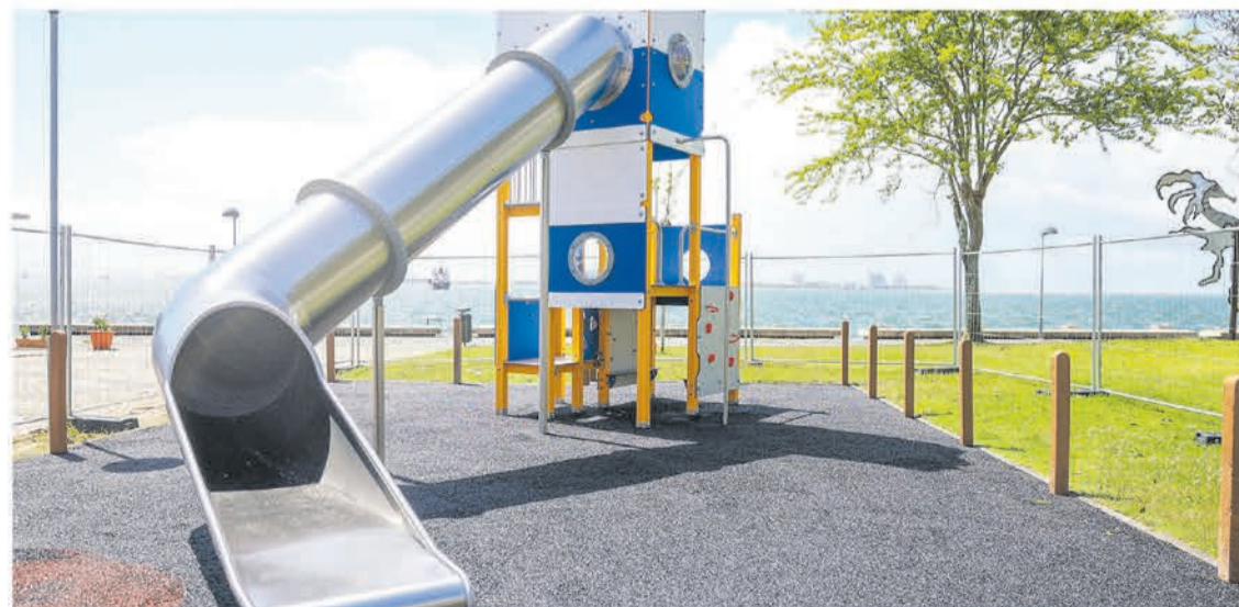
O novo parque infantil do Jardim da Beira-Mar está em fase final de instalação

O espaço, visitado no dia 2 de maio pelo presidente da Câmara Municipal, André Martins, acompanhado da presidente da União das Freguesias de Setúbal, Fátima Silveirinha, repar-te-se em duas áreas, ambas inspiradas na temática do mar.