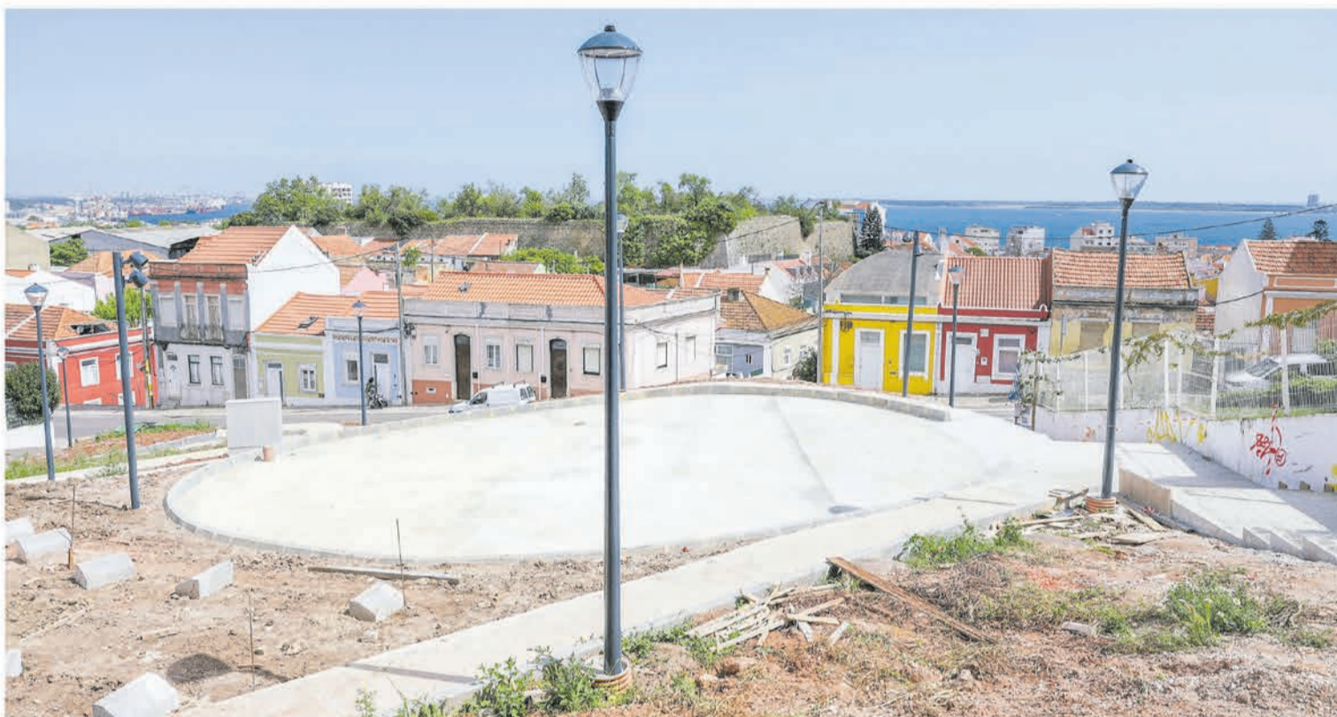
O novo espaço multiusos do Bairro dos Pescadores já tem parte do caminho pedonal construída, para facilitar o acesso dos moradores entre as ruas

CAMINHO PEDONAL PARA UTILIZAÇÃO DOS MORADORES E ANFITEATRO EM ZONA AJARDINADA