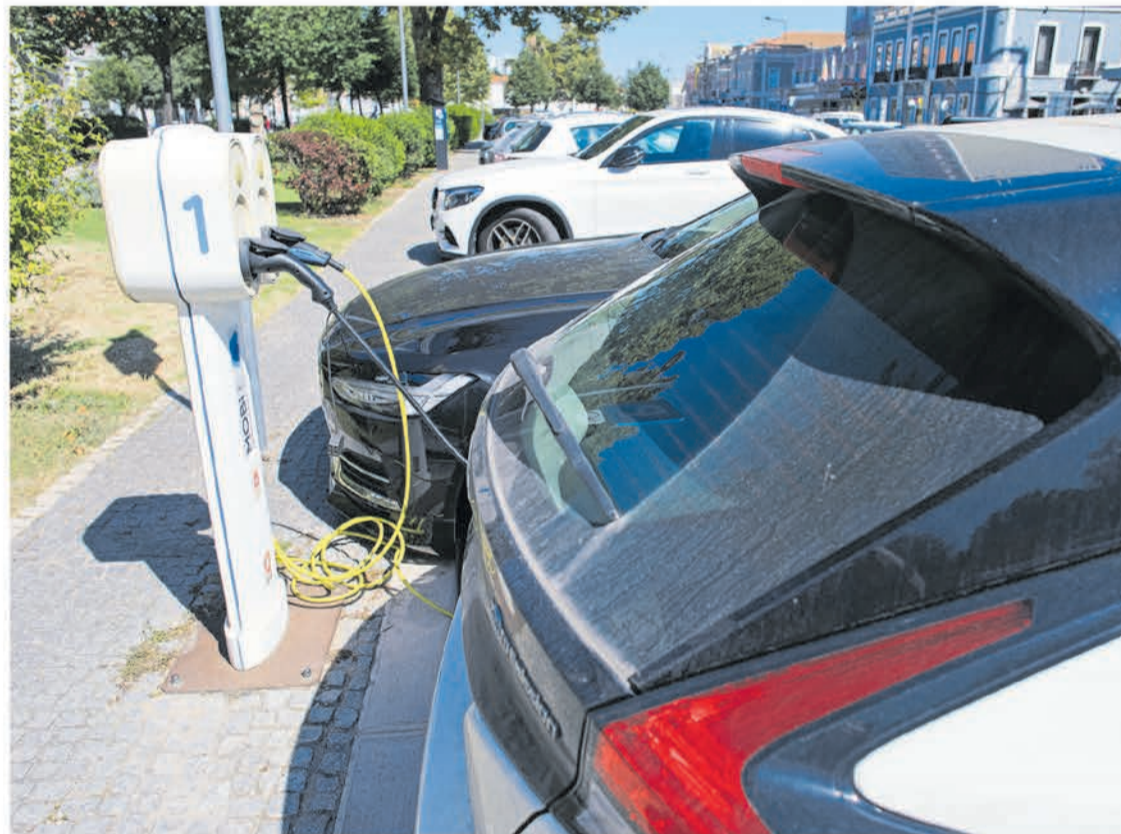
Os postos de carregamento destinam-se a veículos com motorização elétrica parcial ou total

Setúbal vai ter uma rede de 101 postos de carregamento de viaturas elétricas, 21 deles de carregamento rápido, numa iniciativa inserida na estratégia municipal de promoção da mobilidade sustentável. A Câmara Municipal de Setúbal aprovou no dia 21 de maio, em reunião pública, a realização de uma hasta pública que visa a atribuição de 101 licenças de operação de postos de carregamento de baterias elétricas de veículos ligeiros, com motorização parcial ou total elétrica. O objetivo é desenvolver uma infraestrutura de carregamento pública que seja acessível, eficiente e compatível com as necessidades atuais e futuras da comunidade e do meio ambiente.