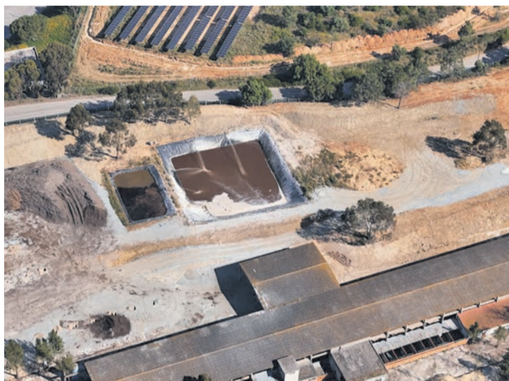
Denúncia veio a público há um mês

A situação, segundo a população local, tem provocado mau cheiro e danos ambientais na zona, afetando árvores e o coberto vegetal. Ao nosso jornal, o autarca revela que as condicionantes que têm colocado têm sido suplantadas pela referida empresa. “A nossa atuação é limitada. Aquilo é um terreno privado e não podemos chegar lá e interromper a atividade. Recentemente tentamos impedir a entrada de viaturas pesadas no local, com a colocação de um conjunto de blocos de betão junto ao portão do terreno, mas logo naquele dia retiraram esses blocos e colocaram um portão novo. Tivemos também conhecimento de que estavam a utilizar água da rede e procedemos ao cor-