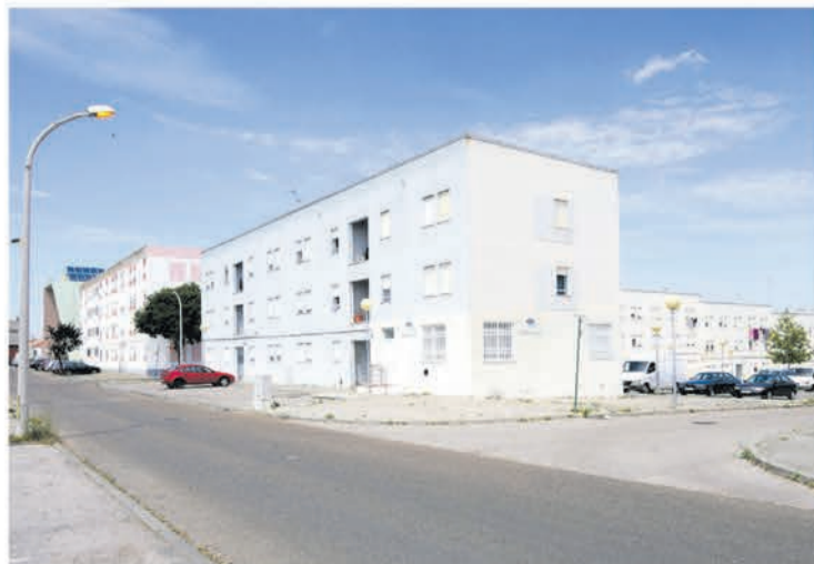
No Bairro da Quinta de Santo António vão ser reabilitados 74 fogos de habitação

A empreitada contempla a substituição de todos os telhados, a reabilitação integral das fachadas e a beneficiação das infraestruturas no interior das frações municipais e zonas comuns de todos os blocos. A autarquia aprovou ainda a adjudicação à empresa Tecnorém da empreitada de reabilitação de 74 fogos no Bairro da Quinta de Santo António, no valor de cerca de 7 milhões e 500 mil euros. A melhoria do desempenho