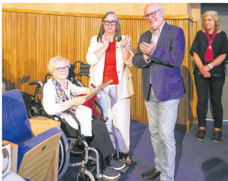
O projeto Vidas de Trabalho homenageia quem ajudou a construir o concelho

O autarca sublinhou que a entrega simbólica de um emble-