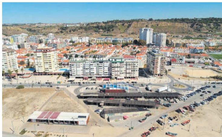
Projeto deverá estar concluído no próximo ano

A obra, ainda de acordo com o autarca local, terá uma parte que irá beneficiar diretamente a atividade piscatória, mas também as vertentes lúdica e cultural. “Por um lado será remodelada a oficina onde costumam ser guardados e reparados os tratores dos pescadores. Além disso, existirá também um espaço amplo onde se possa proceder ao arranjo dos diversos apetrechos e serão criadas condições para que os mesmos possam ser guardados em condições de segurança. Por outro lado, o projeto prevê também a criação de uma sala