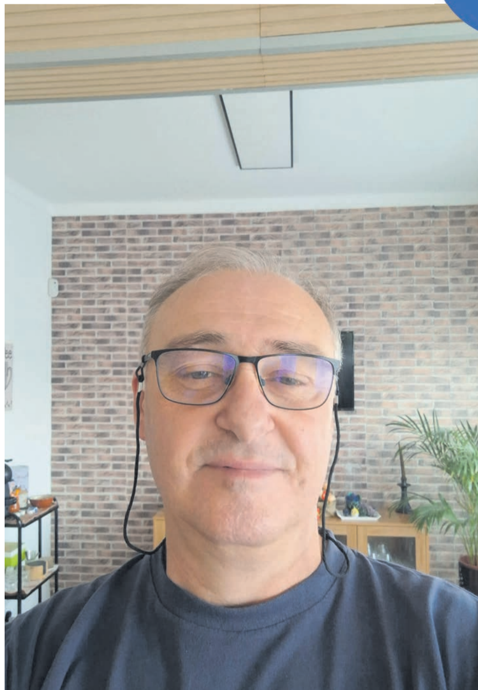
Presidente da UGT Setúbal diz que projeto do governo é desadequado à realidade

O presidente da UGT de Setúbal diz, por outro lado, que o distrito, onde ainda subsistem algumas das principais indústrias do país, “corre