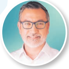
Miguel Feio Candidato do PS