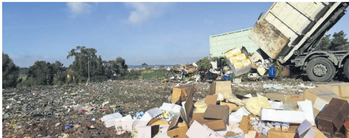
ATERROS COM DESCARGAS ILEGAIS DE RESÍDUOS EM 2024

O dirigente da associação ambientalista disse, por outro lado, que em relação ao Seixal e a Palmela a situação é muito mais grave. “São quantidades muito grandes de resíduos que são depositadas ilegalmente. Ou não se