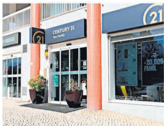
CENTURY 21 Tipy Family (Seixal)

Queremos continuar a crescer, consolidando assim a nossa posição cimeira no mercado imobiliário.