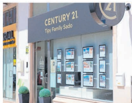
CENTURY 21 Tipy Family (Setúbal)