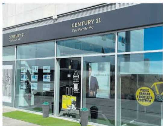
CENTURY 21 Tipy Family (Almada)