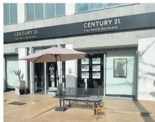
CENTURY 21 Tipy Family (Charneca da Caparica)