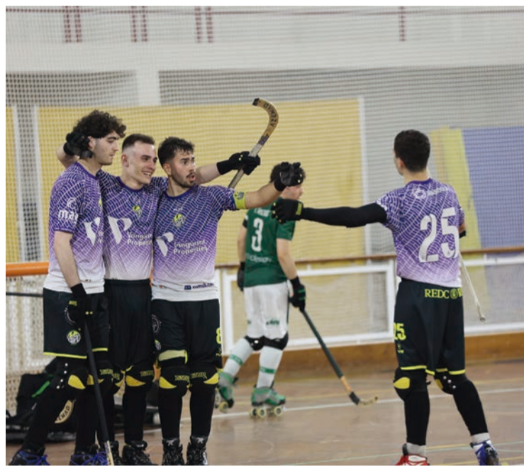
SUB-23 TAMBÉM SONHAM COM O TÍTULO

O dirigente mostra-se orgulhoso pelo percurso da equipa, que soma 26 jogos sem derrotas e terminou a fase regular com o melhor ataque e a melhor defesa da sua série. “Enquanto adepto de hóquei confesso, muito honestamente, aproveitem e vão ao pavilhão ver esta equipa jogar. Têm uma fome de vitória tremenda, qualidade e são extremamente organizados. Mérito à equipa técnica que, com um plantel jovem e curto, conseguiu preparar este conjunto”, acrescentou o dirigente.