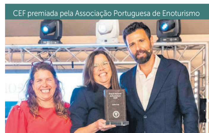
CEF premiada pela Associação Portuguesa de Enoturismo

O Governo diz estar a avaliar alterações à concessão do transporte fluvial entre